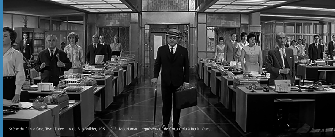
Scène du film « One, Two, Three... » de Billy Wilder, 1961: C. R. MacNamara, représentant de Coca-Cola à Berlin-Ouest.